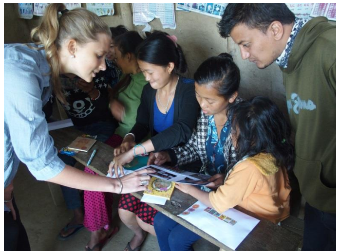
Les enfants parrainés découvrent eux aussi la lettre de leur « sponsor » .

Nous souhaitons exprimer ici la réelle reconnaissance des familles des enfants parrainés. A plusieurs reprises, les parents ont mentionné à quel point la prise en charge financière de la scolarité de leur enfant les soulageait au quotidien et leur donnait de l'espoir pour le futur. Cela représente en effet une chance unique de progrès : les enfants accéderont plus aisément au diplôme de fin d'études secondaires, voire à des études supérieures qu'ils choisiront, sésame pour un emploi et une vie plus digne.