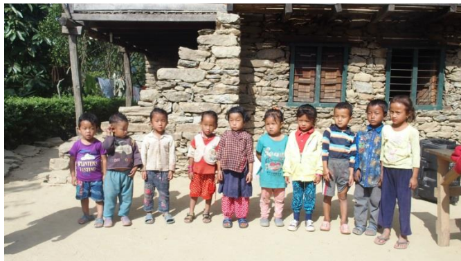
Avant/après la distribution