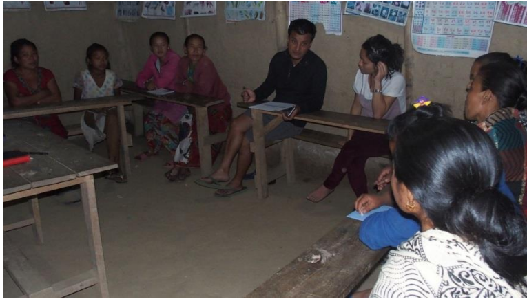
Les enfants nouvellement parrainés se voient expliquer la charte de parrainage de TFN-France....